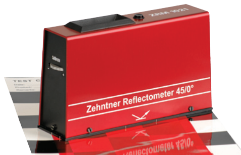
sample of application / Anwendungsbeispiel